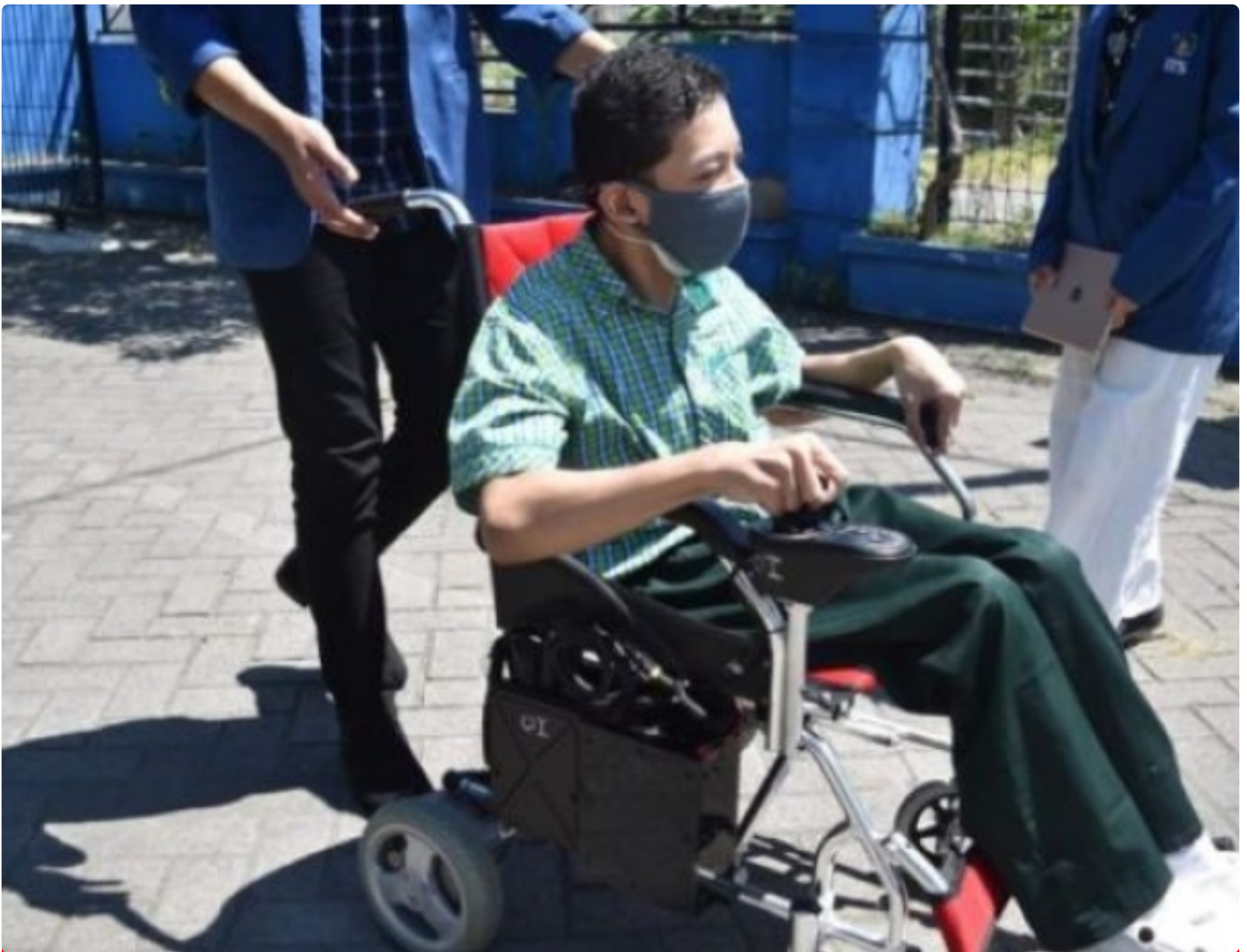
Kursi roda elektrik untuk disabilitas karya mahasiswa Departemen Teknik Biomedik ITS

SURABAYA – Peminatan Teknologi Asistif dan Rehabilitasi Medika merupakan satu dari empat bidang peminatan unggulan di Departemen Teknik Biomedik Institut Teknologi Sepuluh Nopember (ITS). Bidang ilmu ini berfokus pada teknologi medis yang mampu mendukung aktivitas para penyandang disabilitas