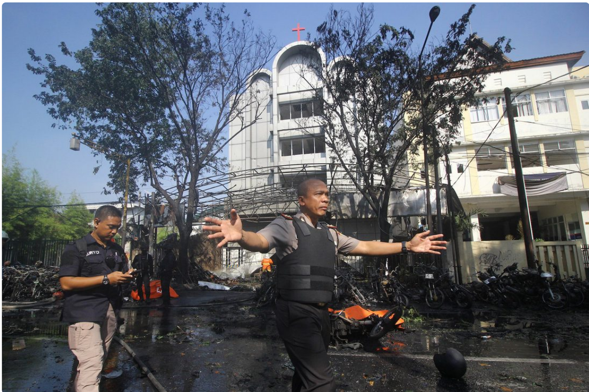
Polisi di depan Gereja Pantekosta Pusat Surabaya (GPPS), salah satu target pengeboman terorisme pada 2018. (Foto: Moch Asim ).

“Strategi kontra-terorisme yang dapat dilakukan pemerintah dalam negeri meliputi beberapa aspek,” tambah Thomas. Di sini Thomas menekankan pentingnya insentif positif. Pemerintah harus memastikan bahwa kesejahteraan ekonomi masyarakat dapat terpenuhi.