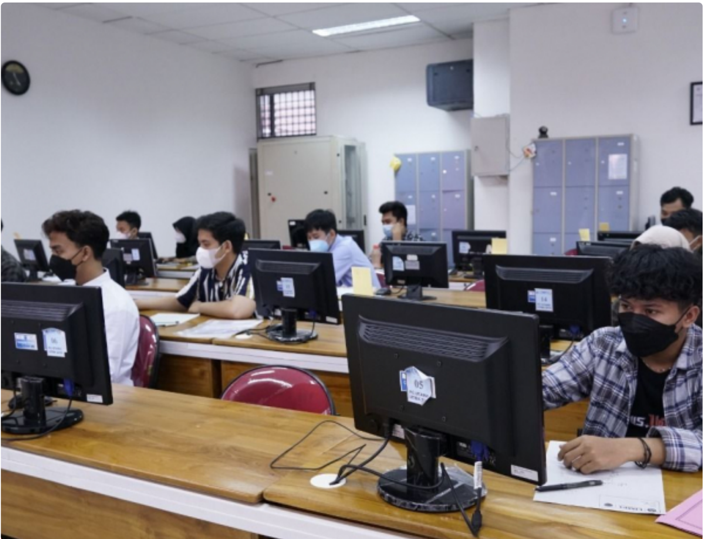
Para peserta UTBK saat mengikuti tes tulis di kampus ITS

SURABAYA – Pengumuman hasil penerimaan Seleksi Bersama Masuk Perguruan Tinggi Negeri (SBMPTN) 2022 telah dapat diakses pada hari ini, Kamis (23/6), pada pukul 15.00. Pada tahun ini, Institut Teknologi Sepuluh Nopember ( ITS ) berhasil meloloskan sebanyak 1.646 dari 19.778 calon mahasiswa baru untuk menjadi bagian dari keluarga besar ITS.