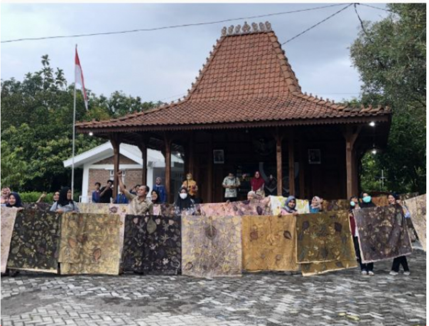
Proses penjemuran kain Ecoprint oleh para peserta KKN Abmas Ecoprint ITS

SURABAYA – Tim Kuliah Kerja Nyata Pengabdian kepada Masyarakat (KKN Abmas) Institut Teknologi Sepuluh Nopember (ITS) mengadakan pelatihan pembuatan Ecoprint di Kelurahan Keputih, Surabaya. Kegiatan ini sekaligus berusaha untuk meningkatkan ekonomi masyarakat lewat karya seni.